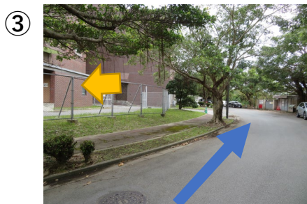
③フェンス横の建物がRI実験施設です(その奥に見える茶色い建物は動物実験施設)。