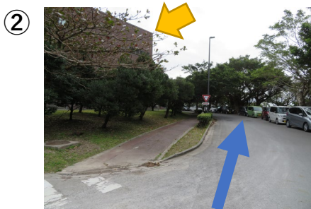
②左手の濃い茶色3階建てがRI実験施設です。