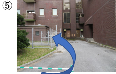
⑤左手のフェンスの中に駐車スペースがあります。検査受付日はフェンスは開いており、入れるようにしています。