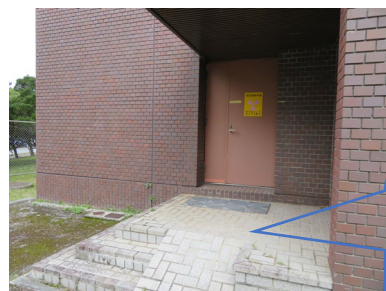
検体(唾液)採取セットを取り、車のなかで採取をお願いします。