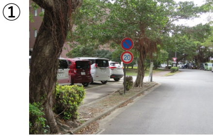
①おきなわシミュレーションセンターを左折 基礎講義実習棟、基礎研究棟 (白っぽい建物)を過ぎます。