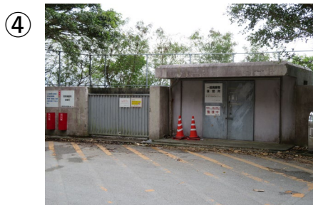
④右手にゴミ集積所があります。ここを越えず、左手がRI実験施設ですので、左折してください。