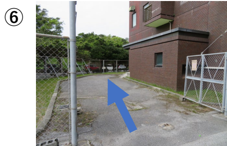
⑥フェンス内へ車を勧めて駐車してください。右手がRI実験施設で検体採取セットが置かれています。